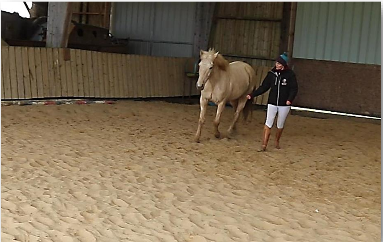
travail de la liberté avec Hawaï, 3 ans et demi

Alors si vous aussi vous voulez tisser une relation complice avec votre cheval, je vous propose dans ce guide mon retour d'expérience et quelques clés et exercices pour vous aider .