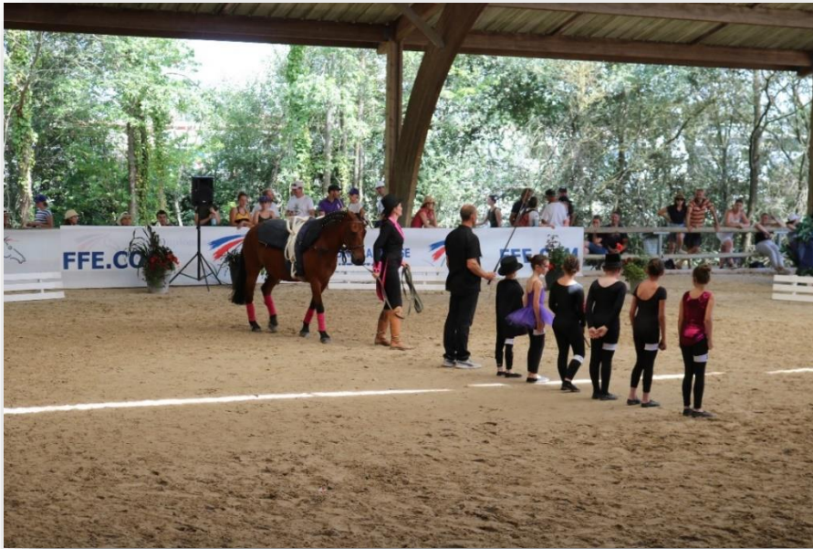
Championnats de France de Voltige 2019, Equipe Club 3, avec mon poney Qoyotte

Le travail à la longe était en fait passionnant, très bénéfique pour le cheval, autant d'un point de vue physique que d'un point de vue mental.