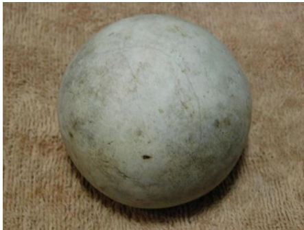
Photo de la boule

C'est plusieurs mois plus tard, lors d'une méditation où la boule était entre mes mains, que le nom m'est venu : Wemaki.